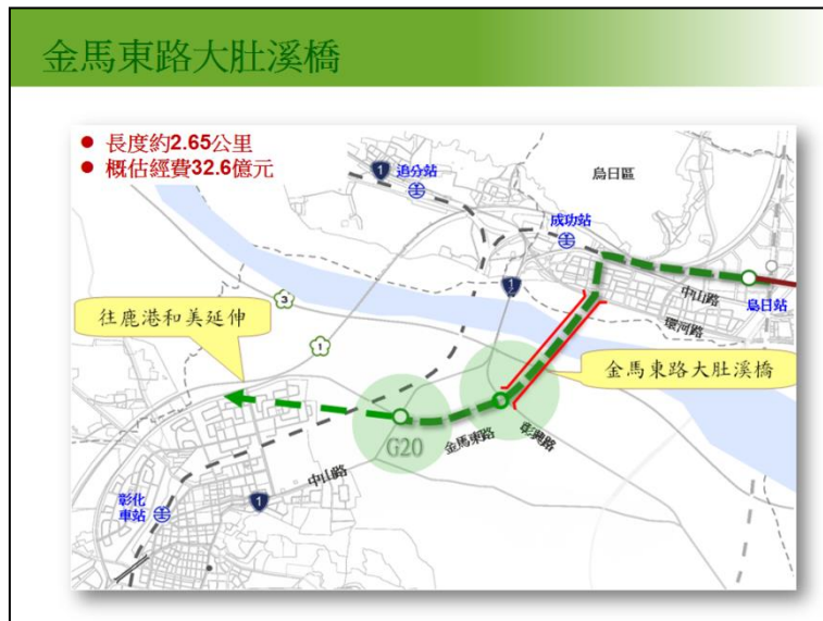
圖 4：金馬東路大肚溪橋計畫示意圖