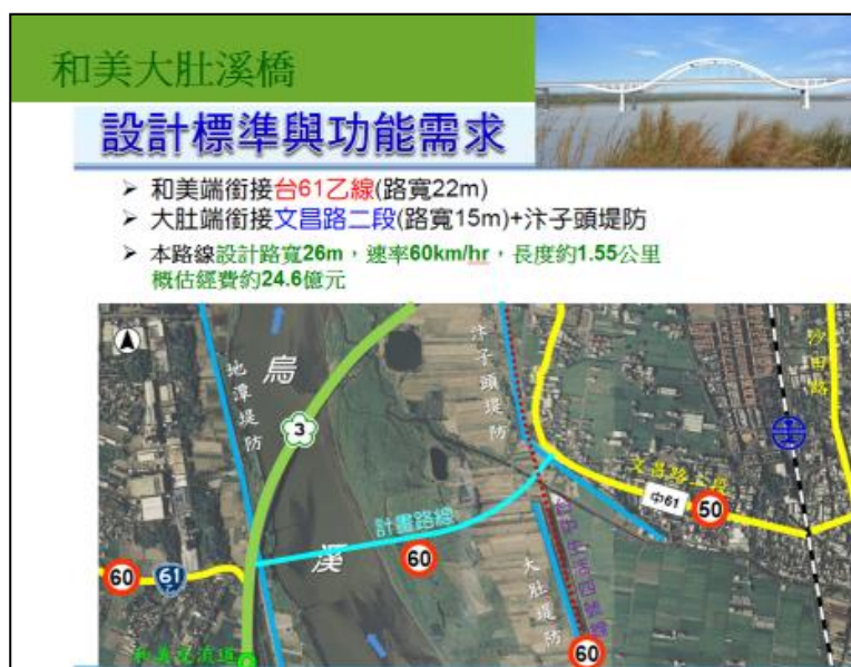
圖 2：和美大肚溪橋計畫示意圖

由本府主政結合捷運路線委託辦理可行性評估作業，本案業已於今年 6 月開始辦理方案評估，廠商已於今年 10 月 8 日提交期中報告，接續邀集相關單位辦理審查作業（如圖 4）。