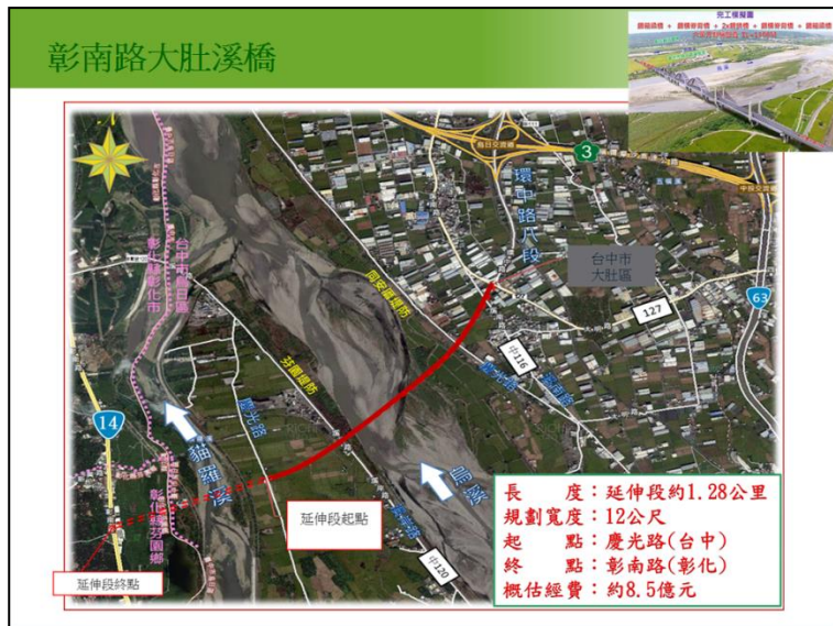
圖 3：彰南路大肚溪橋計畫示意圖