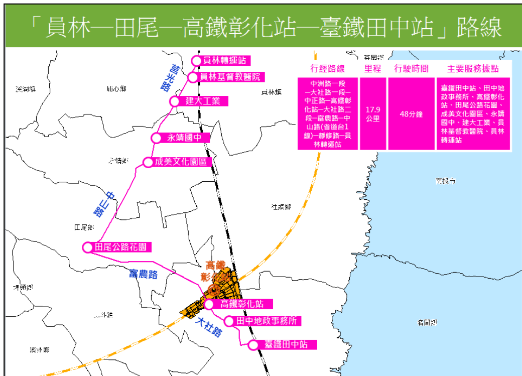
圖 6：「員林-田尾-高鐵彰化站-田中火車站」市區汽車客運路線