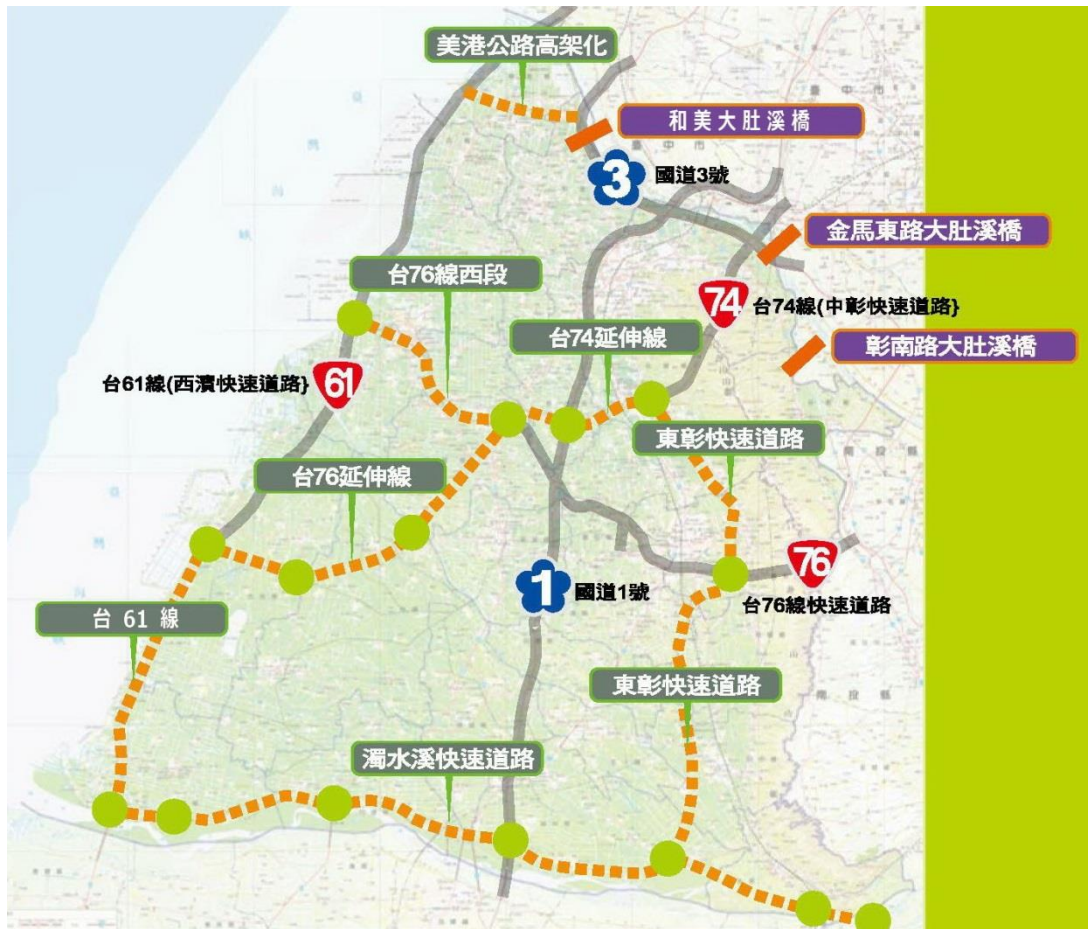
圖 1：彰化縣交通發展願景圖